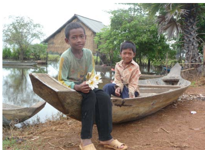
« Chauffeur de taxi » à Dan Roun