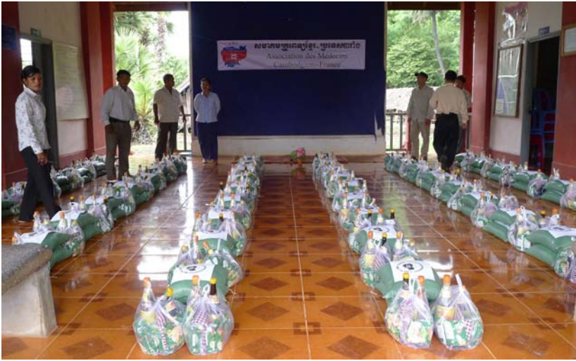
Préparation des dons dans le sala khum de Dan Roun, et remise des lots.