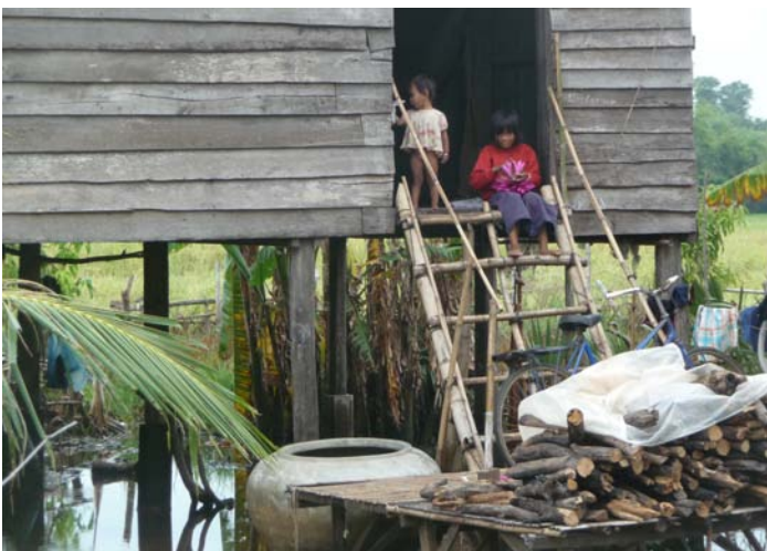
Les inondations à Prei Moul