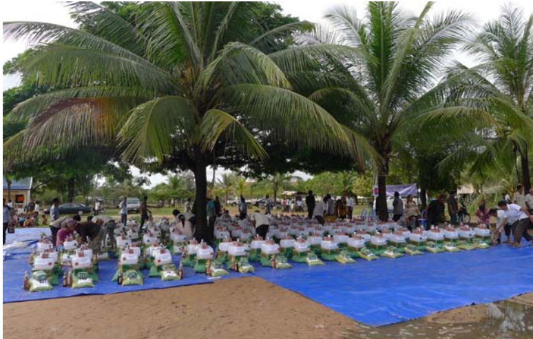
Préparation des dons à Prei Moul et remise des dons