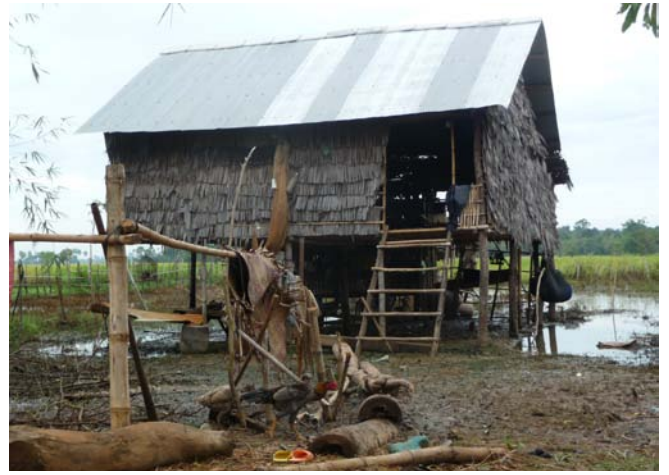
Des maisons sinistrées à Dan Roun, dont une détruite